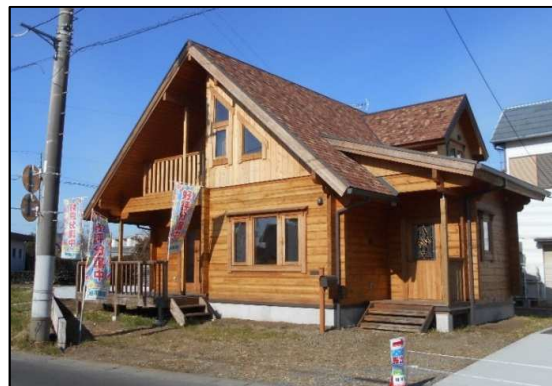
★稀少なログハウス建売